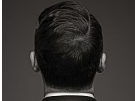
Tiziano Ferro: i 5 motivi per cui ci manca