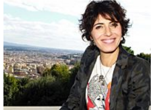
Giorgia è "Senza Paura": la recensione dell'album