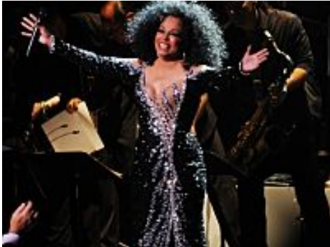
Diana Ross compie 70 anni: le 10 canzoni cult della sua carriera